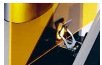
Transmissions-Messung von Feststoffen