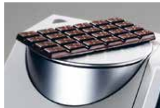
Reflexions-Messung von Feststoffen

Die Messung von Pasten, Pulvern und Granulaten kann einfach mit der optionalen Petri-Schale durchgeführt werden.