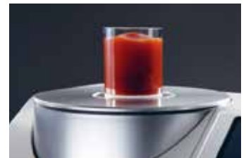
Reflexions-Messung von Pasten

➔ Ohne Aufwand kann die Geräteabdeckung einfach zur Seite geschoben werden und es öffnet sich die große Transmissions-Kammer zur Messung transparenter Festkörper wie Folien oder Glasplatten für die Transmissions-Messung.