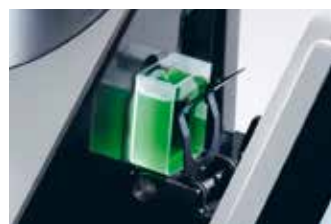
Transmissions-Messung von Flüssigkeiten

Flüssigkeiten können mit einer Glas- oder Kunststoff-Küvette bis zu 60 mm Länge gemessen werden. Ein optionaler Adapter erlaubt den Einsatz von Standard-Küvetten mit einer Breite von 12,5 mm.