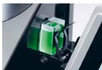
Misura di liquidi in trasmissione