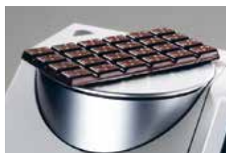
Misura di solidi in riflessione

Si possono utilizzare celle con tragitti ottici fino a 60 mm e di larghezza variabile, incluse le celle standard di 12,5 mm con l'adattatore opzionale.