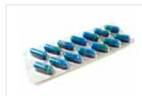
Chimica & Farmaceutica