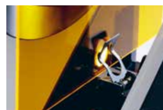
Misura di solidi in trasmissione