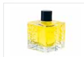
Cosmetici & Profumi