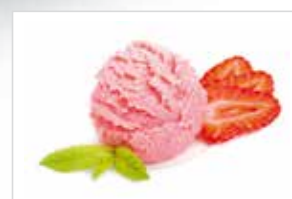
Ingredienti & Alimenti