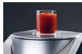
Misura in riflessione di prodotti in pasta